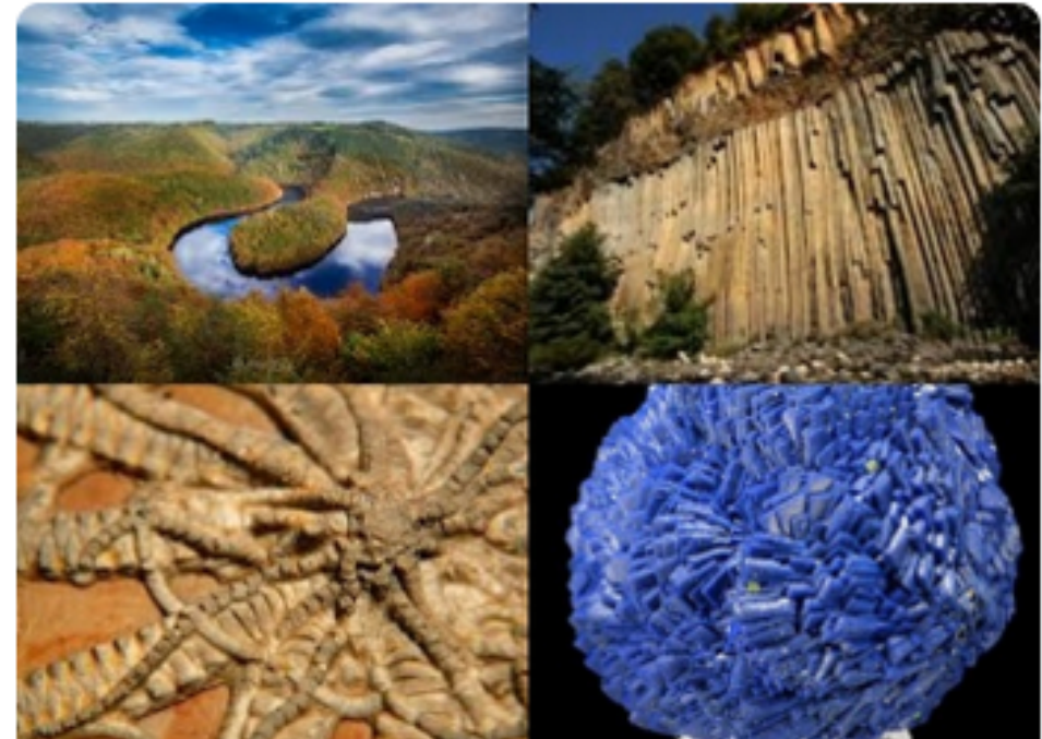
Patrimoine géologique Carte de l'inventaire du patrimoine géologique en Auvergne-Rhône-Alpes

Découvrez la carte de l' inventaire du patrimoine géologique en Auvergne-Rhône-Alpes : la grotte des Fées de Ferrières sur Sichon (03), le Dôme trachytique du Puy Mary (15), le Granite varisque des Sept Laux (38)... Explorez les curiosités géologiques de la région grâce à cette carte interactive !